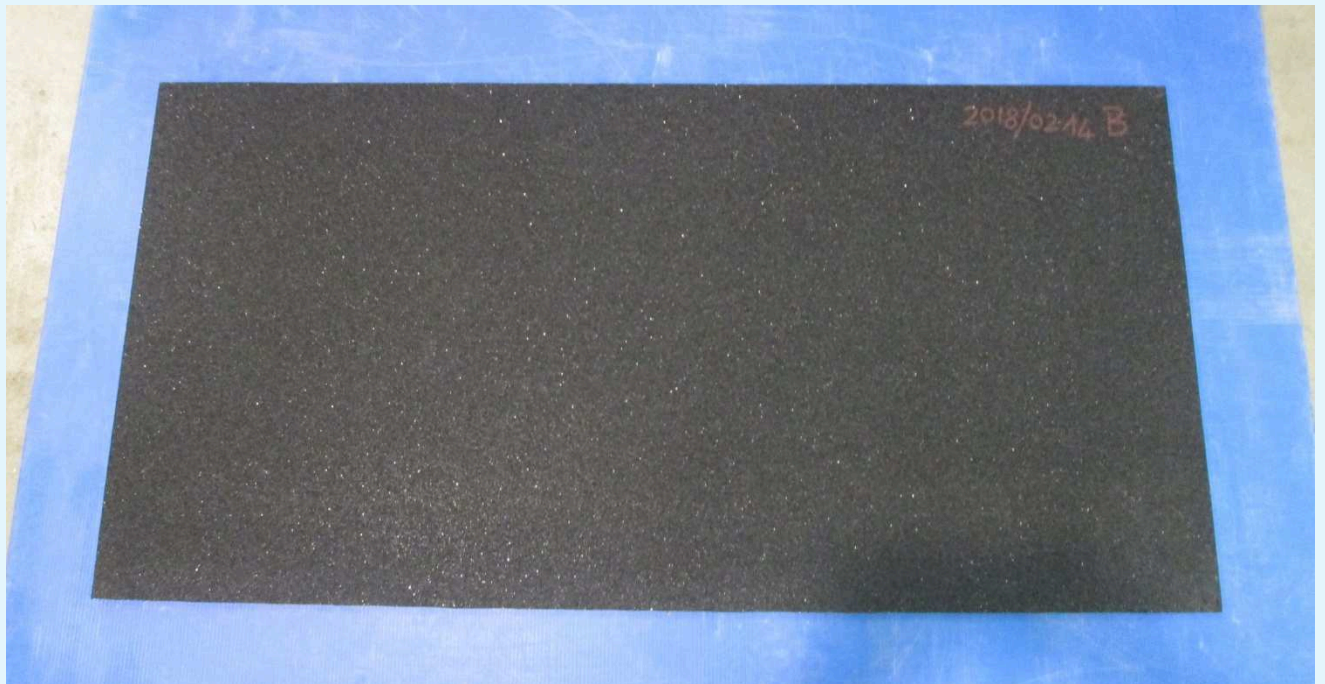
Fotografia del campione.